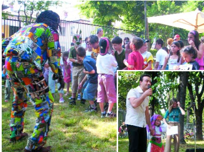
Alcuni momenti della festa interculturale

Un ringraziamento alle comunità albanese, ghanese, peruviana e romena che hanno allietato il pomeriggio anche con alcuni assaggi dei loro piatti tipici. Mirupafshim, la revedere, arriverderci.