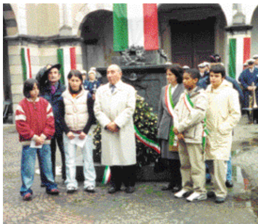
La prima uscita ufficiale del Sindaco e del Consiglio Comunale dei ragazzi e delle ragazze in occasione delle celebrazioni del 25 aprile 2005

Ringrazio anche il comune di Cassano d'Adda che tramite l'Assessorato alla pubblica istruzione ha permesso il nascere di un rapporto costruttivo, di confronto e di collaborazione