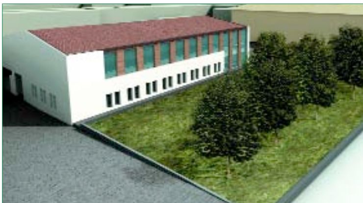
Il nuovo Centro Civico, che avrà una superficie di 1500 mq, sarà pronto per la fine del 2006

Costo totale dell'opera è di 3,2 milioni di euro di cui 200 mila euro sono trasferiti dalla Regione per la parziale copertura dei costi di realizzazione dei posti auto interrati.