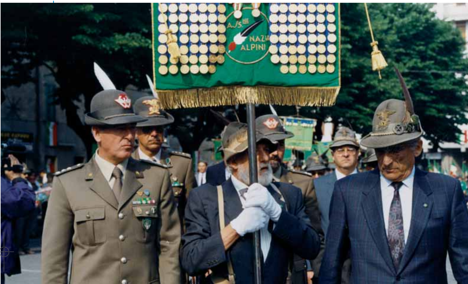
Sfilata alpina del 1989.

Il 14 ottobre il Gruppo Alpini di Cassano in collaborazione con l'Amministrazione Comunale festeggia "alla grande", come ogni cinque anni, la fondazione del Corpo degli Alpini.