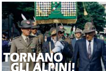
TORNANO GLI ALPINI!