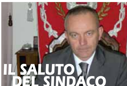
IL SALUTO DEL SINDACO