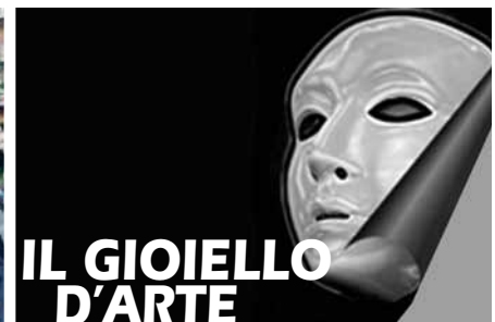
IL GIOIELLO D'ARTE